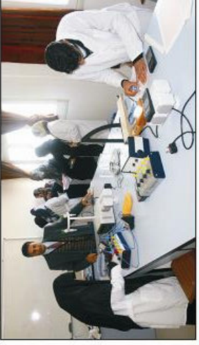
مكتب الجودة: شكر والتقدير لأخ أمين الجامعة على دعمه المتواصل لنبا المكتب الثاني، ولجميع من يرضه المستمر على ضرورة تحقيق معايير الجودة في هذه المؤسسة العلمية كذلك الشكر موصول إلى الإخوة وأقسام الجودة بكليات الجامعة وإلى الإخوة بلجنة مكتب الجودة، والشكر لكم أيضاً بصحة 7 أكتوبر.